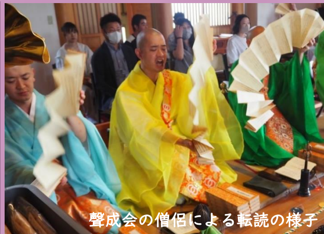
聲成会の僧侶による転読の様子

長福院に江戸時代より伝わる歴史ある経典を手に触れ、貴重な体験をしてみませんか。なお、法要終了後に大般若祈願札・転読修了証・御供物を進呈します（右下図）。